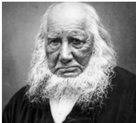
N.F.S. Grundtvig 1783-1872