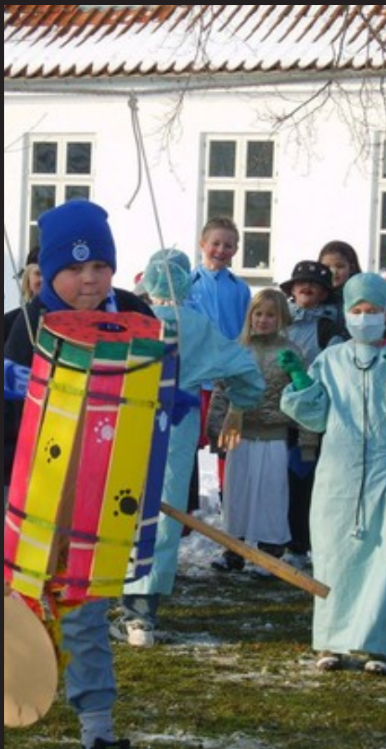
Forsidefoto: Luciaoptog i Munkebo Kirke Bagsidefoto: Tøndeslagning ved konfirmandstuen