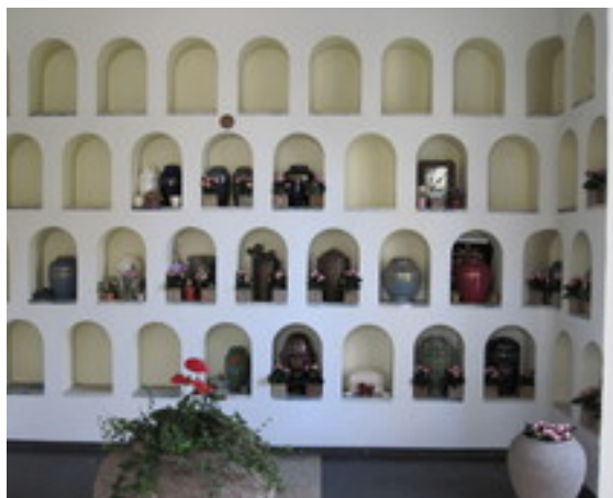
Kolumbarium fra Bispebjerg - læs beskrivelse side 5

En mulighed er at lade kirken stå for vedligeholdelsen. Det koster et årligt beløb, men så er man også sikker på, at gravstedet står pænt. Man kan betale forud for hele perioden. Det ser måske dyrt ud, men ofte kan man tage beløbet fra boet, og så er det klaret – og graveren er fri for bøvlet med at sende rykkerskrivelser ud.